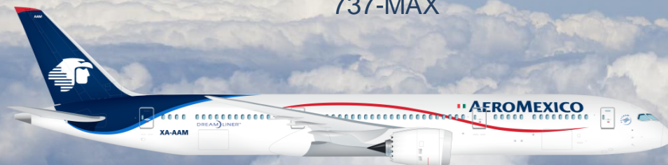
9 Boeing 787-800