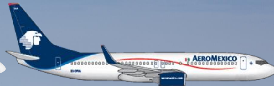
36 Boeing 737-800