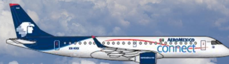
46 EMB 190